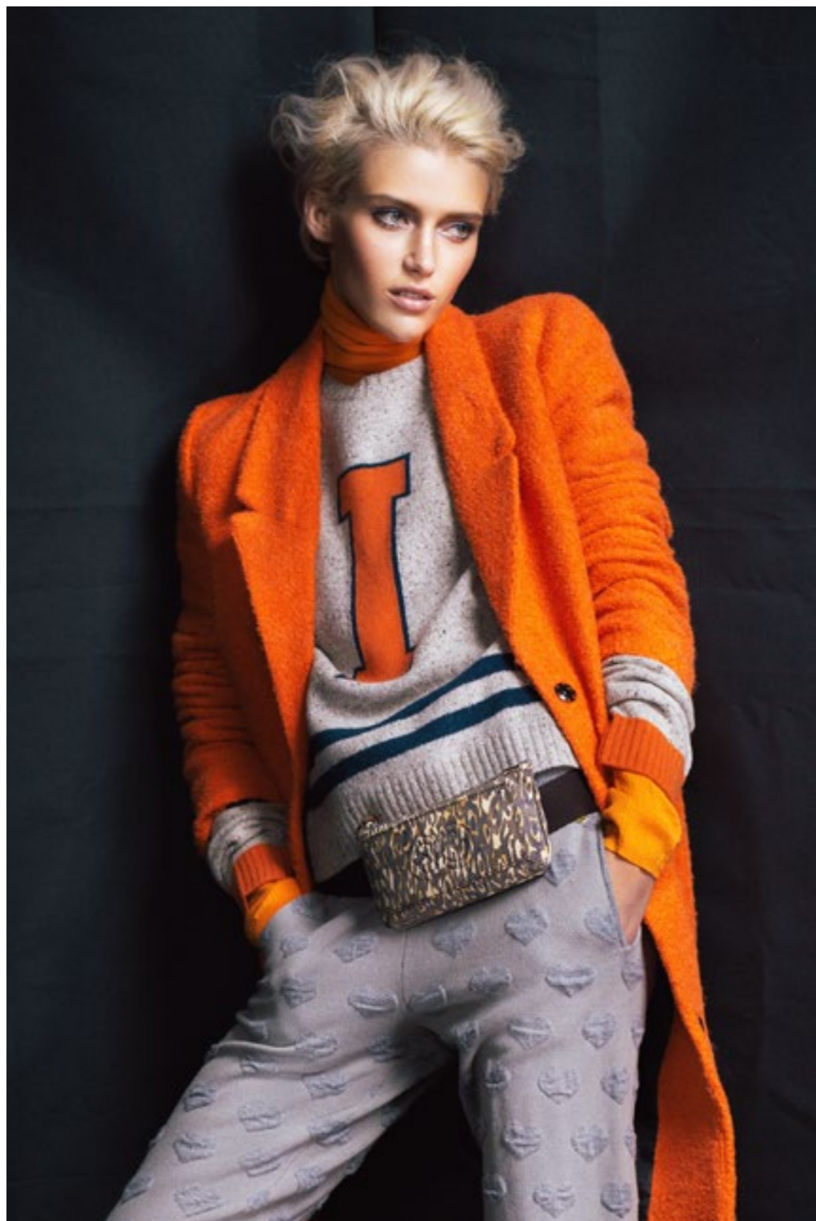
На этом фото: Iceberg Водолазка; Iceberg Джемпер; BeaYukMui Пальто На фото справа: M Missoni Джемпер; Baldaп Босоножки, See by Chloe Пончо