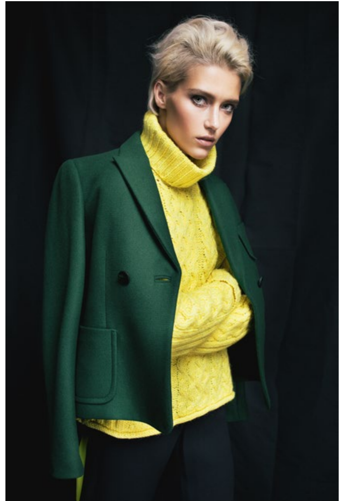
MSGM Брюки; See by Chloe Свитер; Stuart Weitzman Ботильоны