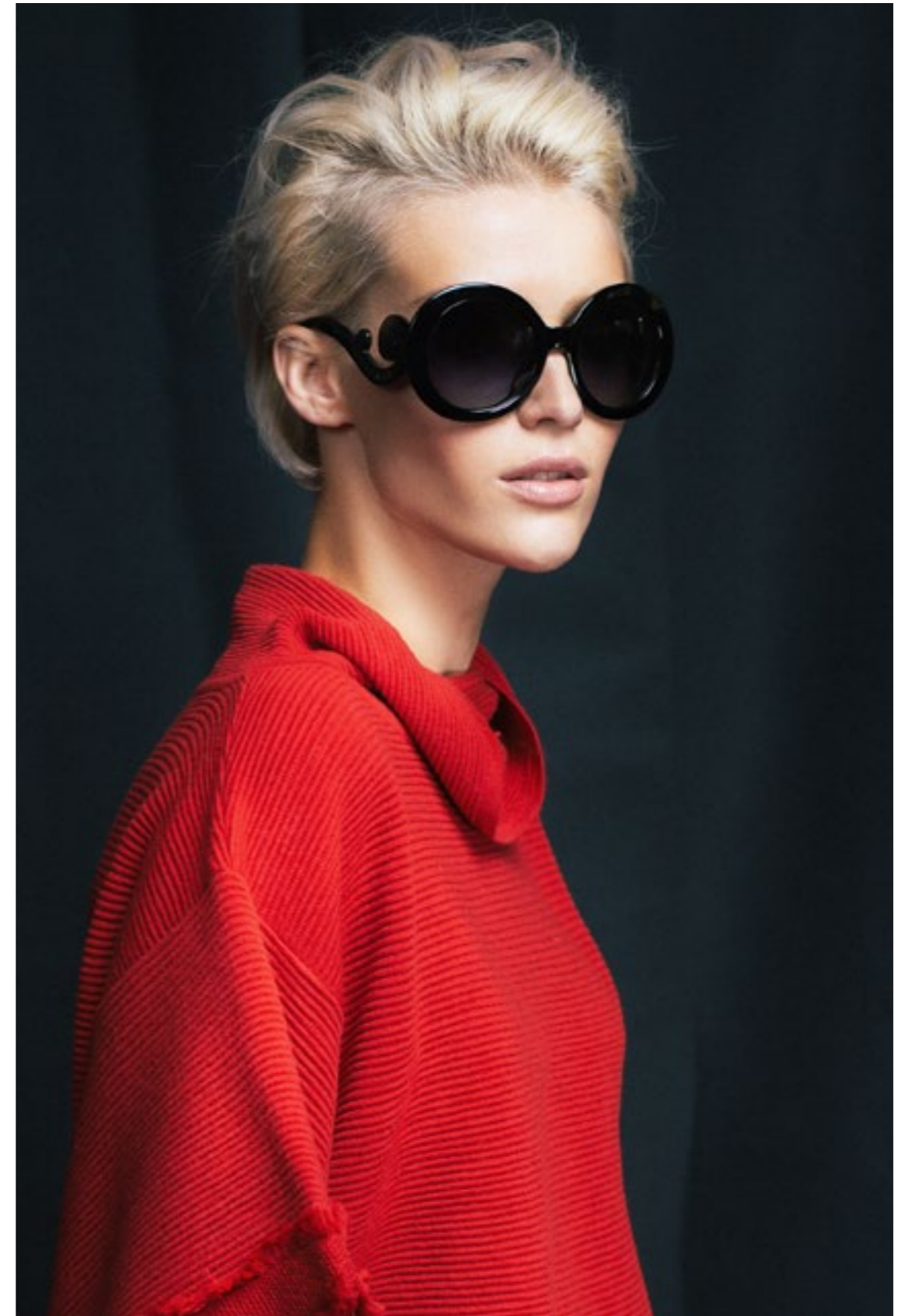
Prada Очки солнцезащитные, Casadei Ботильоны, Boss Orange Брюки