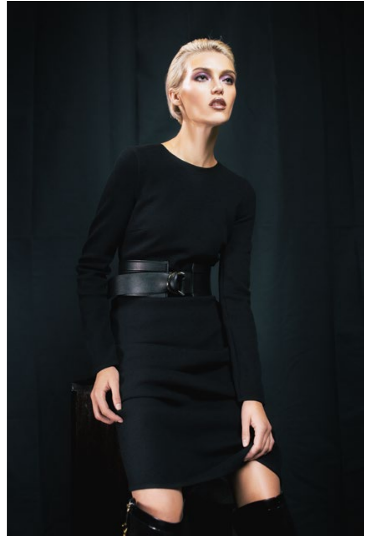
На фото слева: Escada Sport Куртка утепленная; Just Cavalli Блуза; Frankie Morello Брюки, Stuart Weitzman Ботильоны На этом фото: ВСВГМАХАЗРИА Платье, Pinko Пояс, Roberto Botticelli Сапоги