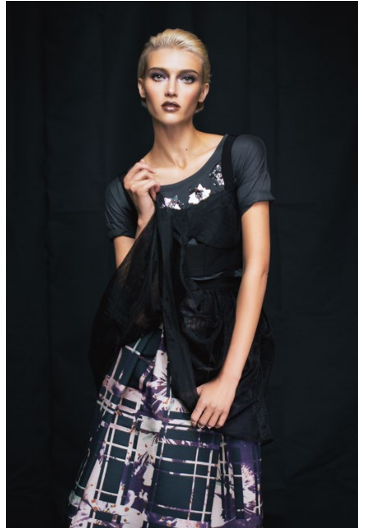
Escada Sport Футболка; Baldinini Полусарафаны; VCBGeneration Платъе; Escada Sport Юбка