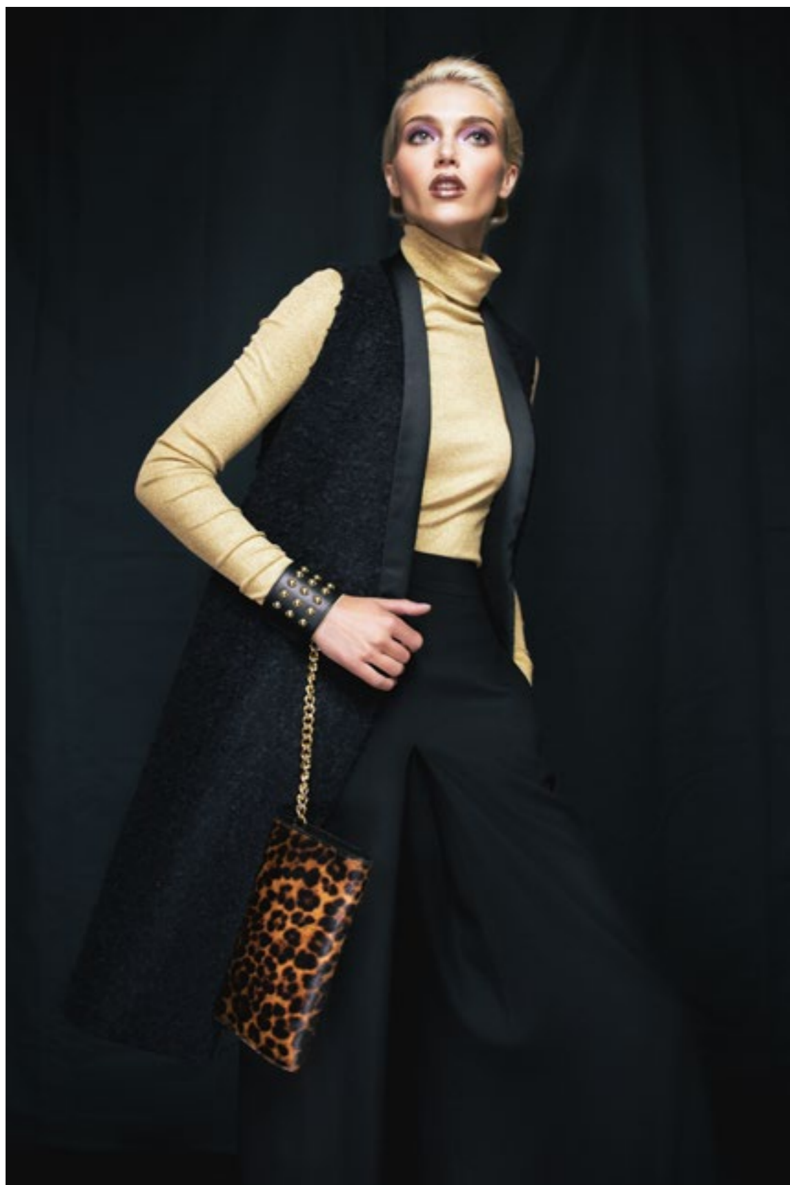
LUBLU Kira Plastinina Брюки; Just Cavalli Жилет; Love Moschino Болеро; Just Cavalli Клатч